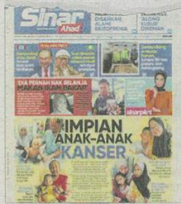
Laporan muka depan Sinar Harian pada 16 Februari lalu.

Sementara itu, KKM menafikan dakwaan bahawa suntikan vaksin Covid-19 menjadi punca peningkatan kes kanser, termasuk dalam kalangan kanak-kanak.