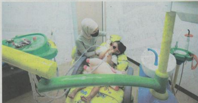
MASA hadapan pergigian halal di Malaysia sangat cerah, dengan potensi besar untuk menjadi peneraju global dalam bidang ini.

Selain itu, terdapat usaha yang lebih besar untuk mengamalkan penjagaan pesakit yang patuh syariah, memastikan rawatan memenuhi prinsip bioetika