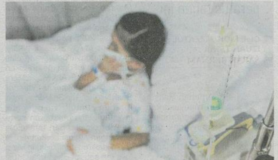
Menurut KKM, kanser kanak-kanak hanya dapat dikesan melalui pemerhatian gejala dan tanda awal. - Gambar hiasan

Menurut KKM, strategi terbaik dalam menangani penyakit ini adalah menerusi pengesanan awal yang melibatkan kesedaran