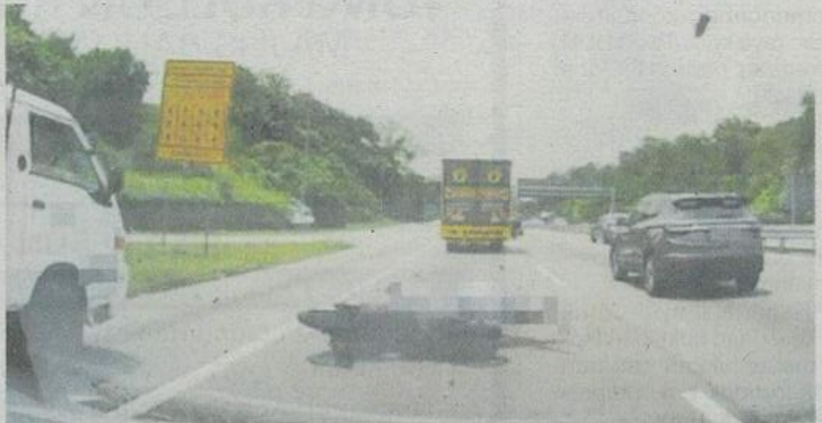
Tangkap layar video tular memaparkan motosikal mangsa melanggar belakang sebuah lori yang berhenti di lorong kecemasan sebelum dilanggar pula oleh kenderaan lain di Lebuhraya Kajang-Silk, Selangor, pada Selasa.

"Apabila sampai di tempat kejadian, mangsa dipercayai telah ter-